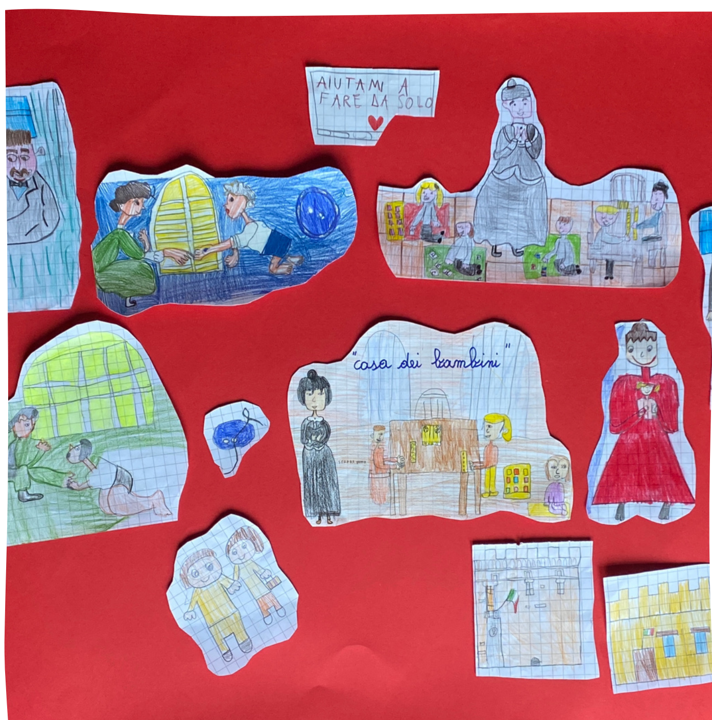
1 Storytelling: scopriamo la vita di Maria Montessori (Mammolina)

INDICARE Modulo/corso (InnoVaMentiSTEM )